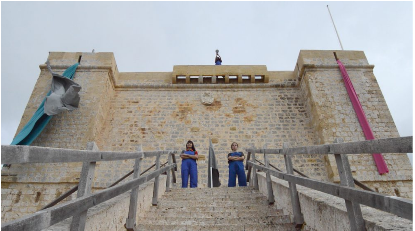
Mario Asef: Kemmuna Nation (2018).