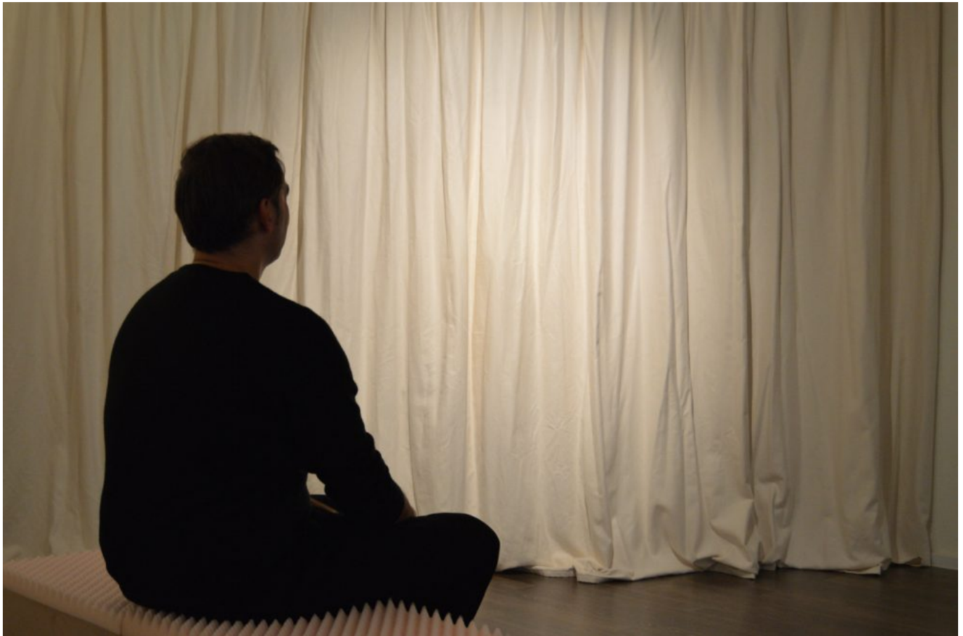
Mario Asef: Acousmatic Lecture Series (2017).

Damit können wir diesen Komplex abschließen. In der letzten Phase unseres heutigen Gesprächs, das wir 2020 fortsetzen werden, soll es um Ihre Überlegungen zur Wissenschaft, zur Kunst und zum Verhältnis beider gehen. Beginnen würde ich gern mit der von Ihnen zusammen mit einigen anderen vertretenen These: „Wissenschaftler arbeiten genauso künstlerisch wie Künstler wissenschaftlich arbeiten.“ Einige w/k-Nutzer, die sich für das Großthema „Kunst und Wissenschaft“ interessieren, werden mit Thesen dieser Art nicht vertraut sein. Um sie auf unserem Weg mitnehmen zu können, sollten Sie auf nachvollziehbare Weise erläutern, was damit gemeint ist.