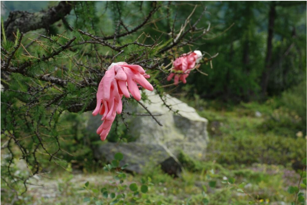
Andrina Jörg: Utiligeneraceae purae, Aqua Manus rosa, Fingerling aus der Fam. Scopae purae, Putzlinge (2020).

Heute ist Forschung in den Künsten etabliert und wird etwa in Österreich und der Schweiz auch staatlich gefördert. Die unterschiedlichen Ausprägungen der verschiedenen Schultypen näherten sich gleichzeitig einander an, sodass z.B. der Schweizerische Nationalfonds bald auch hier von anwendungsorientierter Grundlagenforschung sprach und ab 2011 diese Perspektive in die Evaluation der Forschungsanträge einbezog. Konsequenterweise wurde im selben Jahr von der Philosophisch-historischen Fakultät der Universität Bern gemeinsam mit der HKB die Graduate School of the Arts (GSA) gegründet, das erste und für lange Zeit einzige Schweizerische Doktoratsprogramm für Künstler*innen und Gestalter*innen. Seither ist es in der Schweiz möglich, auch als Absolvent*in von Kunst-, Musik- und Theaterhochschulen universitär zu promovieren. Dieses landesweit einzigartige Modell bietet ein gemeinsames künstlerisch/gestalterisch-wissenschaftliches Doktoratsprogramm Studies in the Arts (SINTA, seit 2019 unter diesem Namen, zuvor als Graduate School of the Arts) an. Diese transdisziplinären SINTA bringen Kunst und Wissenschaft zusammen. Dabei greifen Theorie und Praxis eng ineinander, ebenso Grundlagen- und praxisorientierte Forschung.