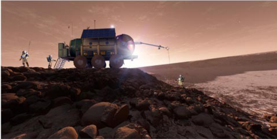
Mars Astronaut's Rover Activity